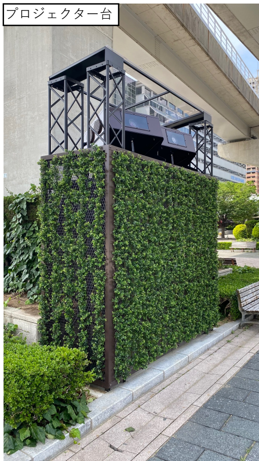
プロジェクター台